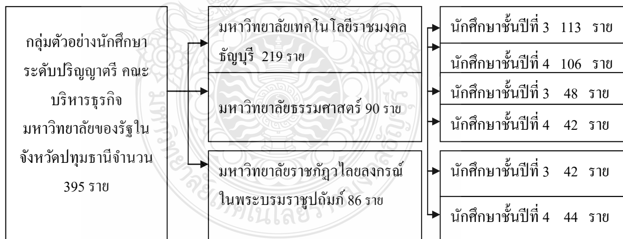
ภาพที่ 3.2 แสดงวิธีการสุ่มกลุ่มตัวอย่างนักศึกษาระดับปริญญาตรี คณะบริหารธุรกิจ ชั้นปีที่ 3 และชั้นปีที่ 4 ที่ศึกษาในมหาวิทยาลัยของรัฐในจังหวัดปทุมธานี