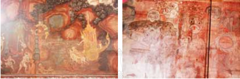
ภาพที่ 6 แสดงภาพสัตว์นรกที่ได้รับโทษทัณฑ์จากการกระทำชั่ว ในแต่ละประเภทของความชั่ว วิเคราะห์จากภาพนรกภูมิ จิตรกรรมฝาผนังวัดมัชฌิมาวาสวรวิหาร และวัดโพธิ์ปฐมาวาส สงขลา

ความเชื่อในไตรภูมิโลกสัมพันธ์ ไตรภูมิ แปลว่า แดนสามได้แก่ กามภูมิ ภูมิ และอรุภูมิ กามภูมิ คือ นรกระดับต่างๆ เป็นแดนทุกข์เดือดร้อนอยู่ใน กามตัณหา ซึ่งเขียนภาพไว้ตอนล่างของผนังมักขำรุดลบลื่อน โลกมนุษย์และ สวรรค์ระดับล่างได้แก่ สวรรค์ดาวดึงส์ ก็รวมอยู่ในกามภูมิสวรรค์ชั้นดาวดึงส์ อยู่เหนือยอดเขาพระสุเมรุอันเป็นแกนจักรวาลล้อมรอบด้วยภูเขาวงแหวน ลดหลั่นกันเจ็ดวงที่เรียกว่า ภูเขาสัตตบริภัณฑ์เหนือขึ้นไปจากกามภูมิคืออรุภูมิ เป็นแดนของพรหมแบ่งออกเป็นหลายระดับก่อนไปถึงอรุภูมิเป็นชั้นพรหม ที่ไม่มีรูปเพราะหมดสิ้นกิเลสใดๆ ทั้งปวง พื้นนั้นคือ อากาศธาตุอันหมายถึง สภาวะแห่งนิพพาน (สันติ เล็กสุขุม, 2548 : 19-20) ไตรภูมิ คือ การชี้ให้เห็น โทษของการทำชั่วและผลของการทำดี สรรพสัตว์ทั้งหลายย่อมเวียนวนไปมา และเกิดในสามภูมินี้ตามแต่บุญบาปที่ตนกระทำไว้ถ้าสร้างกรรมดีก็จะได้ไปเกิด ที่เป็นสุข คือ “สวรรค์” หากสร้างกรรมชั่วก็จะไปเกิดที่ชั่ว คือ “นรก” (สมชาติ มณีโชติ, 2529 : 88) ดังปรากฏภาพด้านหลังพระประธานวัดสุนทราวาสและวัด