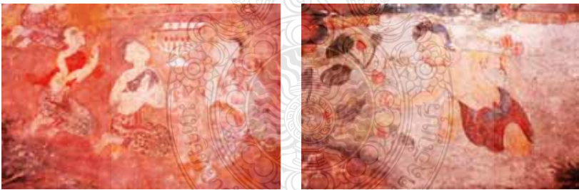
ภาพที่ 8 แสดงภาพชาวบ้านไปพึ่งเทคน์และภาพชายเข้ญใจเก็บดอกบัวถวาย พระมาลัยตามความเชื่อยอมได้บุญกุศลมาก วิเคราะห์จากจิตรกรรมฝาผนังวัดโพธิ์ปฐมาวาส จังหวัดสงขลา

2529 : 3453) ดังนั้นชาวใต้จึงนิยมสร้างวัดไว้ใกล้บ้าน หรือผู้ที่มีตระกูลนิยมสร้างวัดประจำตระกูลไว้ เพื่อบุตรหลานได้บวชเรียน เพื่อจะใช้เป็นที่ประกอบพิธีกรรมอื่นๆ ทางพุทธศาสนา เช่น การเผาศพ เก็บกระดูก และทำบุญต่างๆ ตามประเพณีท้องถิ่นเช่น ประเพณีทำบุญอุทิศส่วนบุญส่วนกุศลให้กับผู้ล่วงลับไปแล้วที่สัมพันธ์กับความเชื่อในเรื่องความเชื่อเรื่องภูตผีวิญญาน (ภาพที่ 11) เช่น ช่างจะวาดภาพประเพณีการทำบุญเดือนสิบ (ภาพที่ 12) แทรกในภาพพุทธประวัติ วัดวังเพระมีความเชื่อในการอุทิศส่วนบุญส่วนกุศลให้กับผู้ตายและตลอดจนเป็นที่พบปะ พักผ่อนหย่อนใจ เพราะถือว่าวัดเป็นศูนย์กลางของชาวบ้านในละแวกนั้น และเป็นที่พึ่งทางใจเป็นนาบุญของชาวบ้าน และจะนิยมสร้างวัดหรือ ศาสนสถานขนาดใหญ่ให้เป็นศูนย์กลางของคนในชุมชน