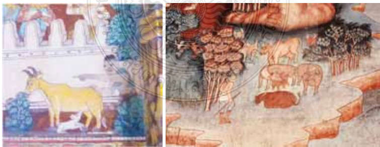
ภาพที่ 10 แสดงภาพความเมตตาต่อสัตว์จะได้บุญกุศลกับตนเองเพื่ออนาคตชาติ วิเคราะห จากจิตรกรรมฝาผนังวัดชลธาราสিংเห จังหวัดนราธิวาส และจิตรกรรมฝาผนังวัดวัง จังหวัดพัทลุง