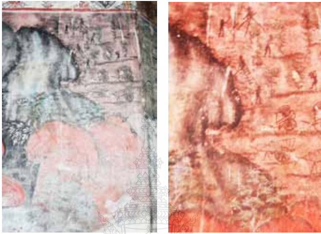
ภาพที่ 9 แสดงภาพความเชื่อว่าการสร้างสาธารณประโยชน์ ได้บุญกุศลมากวิเคราะห จากจิตรกรรมฝาผนังวัดโพธิ์ปฐมาวาส จังหวัดสงขลา