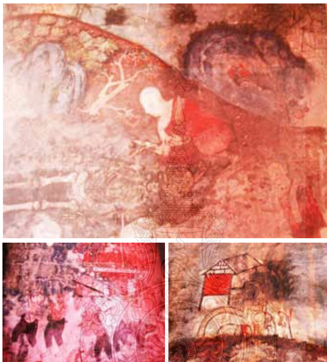
ภาพที่ 2 ภาพสะท้อนความเชื่อ ศิลปวัฒนธรรมของพุทธศาสนา อิสลาม จีน ตามแนวความคิดของเจ้าเมืองสงขลาเพื่อความเป็นเอกภาพและลดความขัดแย้งทางสังคม วิเคราะห์จากภาพจิตรกรรมฝาผนังวัดโพธิ์ปฐมาวาส สงขลา