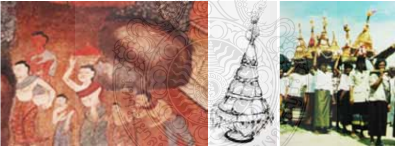
ภาพที่ 12 แสดงภาพการทำบุญเดือนสิบตามความเชื่อ ในการอุทิศส่วนบุญส่วนกุศลให้กับผู้ตาย วิเคราะห์จากจิตรกรรมฝาผนังวัดวัง จังหวัดพัทลุง