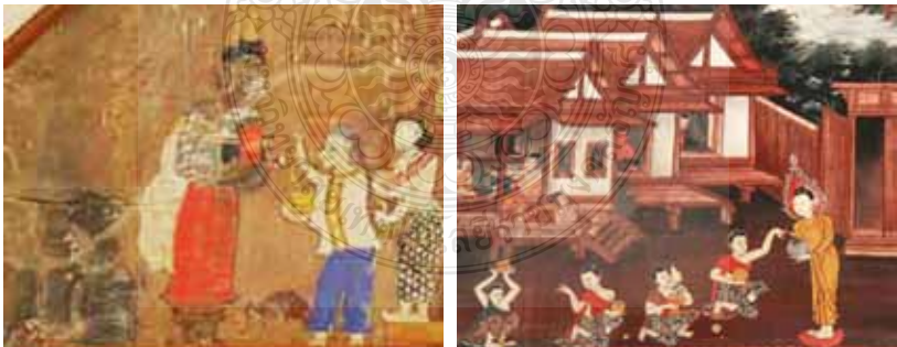
ภาพที่ 13 แสดงภาพการทำบุญตักบาตรกับพระสงฆ์ของชาวบ้าน เป็นการสะสมบุญ เพื่ออนาคตชาติ วิเคราะห์จากจิตรกรรมฝาผนังวัดวัดป่าศรี จังหวัดปัตตานี และจิตรกรรมฝาผนังวัดมณีฆังมาวาสวิหาร จังหวัดสงขลา

สรุปได้ว่าจิตรกรรมฝาผนังของภาคใต้ จะแสดงถึงความเชื่อความศรัทธาต่อพุทธศาสนาของชาวบ้านโดยการสร้างวัดในชุมชนและเขียนภาพจิตรกรรมฝาผนังที่แสดงถึงการสืบสานและเชื่อความศรัทธาต่อพุทธศาสนา ดังเช่นเรื่องทศชาติชาดก ตอนพระเวสสันดรชาดก เป็นการเสวยพระชาติพระโพธิสัตว์ของการทานบารมีอันยิ่งใหญ่ และนำไปสู่การจุติเป็นพระพุทธรูปเจ้าตั้งปรากฏภาพวัดคูเต่าและการวาดภาพที่สอดคล้องกับความเชื่อในเรื่องกฎแห่งกรรมที่มีจุดเชื่อมโยงกัน 3 จุด คืออดีตชาติ - ปัจจุบันชาติ - อนาคตชาติผสมผสานกับการแสดงถึงคติความเชื่อของท้องถิ่นภาคใต้ของวัดที่จะทิ้งพระโดยการวาดภาพชาวบ้านไปวัดเพื่อทำบุญและภาพการทำบุญตักบาตรกับพระสงฆ์ของชาวบ้าน เป็นการสะสมบุญเพื่ออนาคตชาติของวัดป่าศรี และวัดมณีฆังมาวาสวิหาร (ภาพที่ 13) ข่างวาดภาพการทำบุญอุทิศส่วนกุศลให้กับบรรพบุรุษด้วยการทำบุญตักบาตรอันเป็นความเชื่อในพุทธศาสนาตามประเพณีท้องถิ่นภาคใต้