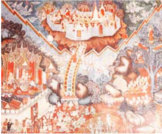
ภาพที่ 4 แสดงภาพความเชื่อไตรภูมิที่เชื่อมโยง อดีตชาติ - ปัจจุบันชาติ - อนาคตชาติ วิเคราะห์จากจิตรกรรมฝาผนังวัดวังพัทลุง