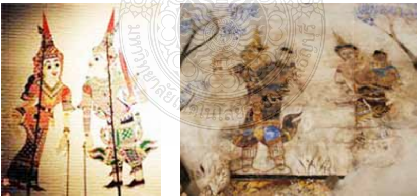
ภาพที่ 5 แสดงความเชื่อในการบำเพ็ญเพียรในภพชาติ เพื่อนำไปสู่การตรัสรู้ สุนิพนวนวิเคราะห์จากจิตรกรรมฝาผนังวัดคูเต่า สงขลา