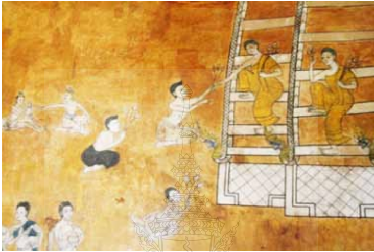
ภาพที่ 1 ภาพชาวบ้านถวายดอกบัวแด่พระสงฆ์เพื่อการสะสมบุญ วิเคราะห์จากจิตรกรรมฝาผนังวัดจะทิ้งพระสงขลา

ลักษณะเด่นของพุทธศาสนาของภาคใต้ เกิดจากการสั่งสมองค์ความรู้แล้วพัฒนาเป็นภูมิปัญญา ซึ่งลักษณะเด่นบางอย่างเป็นอุบายธรรมหรือเป็นเพียงสิ่งที่ต้องการให้ผู้คนในแถบนี้เข้าถึงพุทธธรรม เพราะภาพดังกล่าวแฝงเร้นด้วยหลักธรรมคำสอนของพระพุทธเจ้าซึ่งเป็นเรื่องความจริงที่มีอยู่ตามธรรมชาติและเป็นของกลางสำหรับทุกคน อันจะนำไปสู่ศูนยรรวมทั้งทางด้านจิตใจของคนในชุมชนให้เกิดพลังความสามัคคีกลมเกลียวและอยู่ร่วมกันด้วยความสงบสุขและเป็นอันหนึ่งอันเดียวกันท่ามกลางความเชื่อที่หลากหลายในแต่ละศาสนา ดังเช่นภาพจิตรกรรมฝาผนังวัดโพธิ์ปฐมาวาสที่ผสมผสานความเชื่อศาสนาอิสลาม ศาสนาพุทธ ศาสนาพราหมณ์อยู่ในวัดเดียวกัน แต่มีศาสนาพุทธเป็นแกนหลักและให้ความสำคัญมากกว่าศาสนาอื่นๆ (ภาพที่ 2)