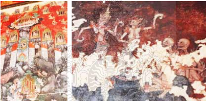
ภาพที่ 7 แสดงภาพตามความเชื่อของผลการทำกรรมดี (สุวรรณค์) - กรรมชั่ว (นรก) วิเคราะห์จากจิตรกรรมฝาผนังวัดสุวรรณคีรี สงขลา

สุวรรณคีรี (ภาพที่ 7) แสดงให้เห็นตามความเชื่อของผลการทำกรรมดี - กรรมชั่ว ช่างโบราณจะวาดภาพตามความเชื่อไตรภูมิเป็นความเชื่อเกี่ยวกับภพภูมิว่ามีจริง โดยจะแสดงออกทั้ง 3 ภูมิในผนังเดียวกัน เพื่อให้เห็นถึงหลักกฎแห่งกรรมและหลักสังสารวัฏ การเวียนว่ายตายเกิดในภพภูมิตายแล้วเวียนกลับมาไม่สูญหายคงวนเวียนอยู่เพื่อเกิดในชาติใหม่ภพใหม่ อันเนื่องมาจากผลของการกระทำในอดีตชาติ ปัจจุบันชาติส่งผลในอนาคตชาติ ซึ่งช่างจะออกแบบตามความเชื่อและเหมาะสมของพื้นที่ของพระอุโบสถในแต่ละวัด