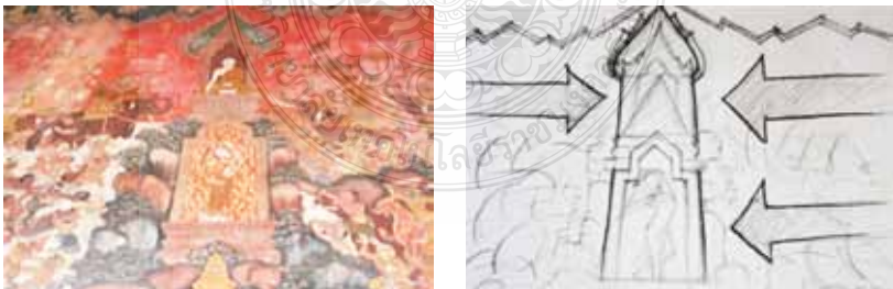
ภาพที่ 3 แสดงภาพความเชื่อในการตั้งมั่นแน่วแน่กับสมาธิ สามารถชนะ และหลุดพ้นจากกิเลสทั้งปวง

แต่ละพระชาติเป็นการประพุดิปฏิบัติตามหลักพระพุทธศาสนาเพื่อจุดมุ่งหมาย สู่นิพพาน เช่น ภาพตอนอุริที่ตัดขาดก เสวยพระชาติเป็นพญานาคจะต้องทน ทุกข์แสนสาหัสกับกรรมที่ได้กระทำมา ซึ่งจะต้องสำรอกพิษพันไฟในการแสดง รวมทั้งพระชาติสุดท้ายของเจ้าชายสิทธัตถะได้ออกผนวชปฏิบัติธรรมเพื่อให้ หลุดพ้นจากกิเลสทั้งปวง พ้นจากการเวียนว่ายตายเกิดสิ้นภพสิ้นชาติจนได้ ตรัสรู้สู่นิพพาน (ภาพที่ 5) และช่างได้แสดงเทคนิคเชิงช่างที่มีอัตลักษณ์ด้วยการ สอดแทรกความเป็นลักษณะเด่นของศิลปะท้องถิ่นด้วยการวาดภาพพระเวสสันดร แบบตัวหนังตะลุงโดยฝีมือช่างท้องถิ่นที่มีความเป็นอิสระในการออกแบบภาพซึ่ง ช่างจะวาดภาพตามความเชื่อดังกล่าวอันแสดงให้เห็นถึงผลของการทำดีปฏิบัติ ตามหลักคำสอนของพุทธเจ้าจะสามารถหลุดพ้นได้และภาพผลของการทำชั่ว ดังปรากฏภาพพระเนมิราชทองนรกและสวรรค์ของวัดมัชฌิมาวาสวรวิหาร (ภาพที่ 6) และวัดโพธิ์ปฐมาวาสภาพนรกภูมิบริเวณผนังด้านหลังพระประธาน แสดงภาพสัตว์นรกที่ได้รับโทษทัณฑ์จากการกระทำชั่วในแต่ละประเภทของ ความชั่ว