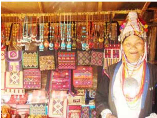
ภาพที่ 6 ร้านจำหน่ายของที่ระลึกของชนเผ่าอู๋โล้อ่าซ่า