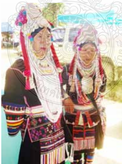
ภาพที่ 7 การแต่งกายของชนเผ่าอู๋โล้อ่าซ่า