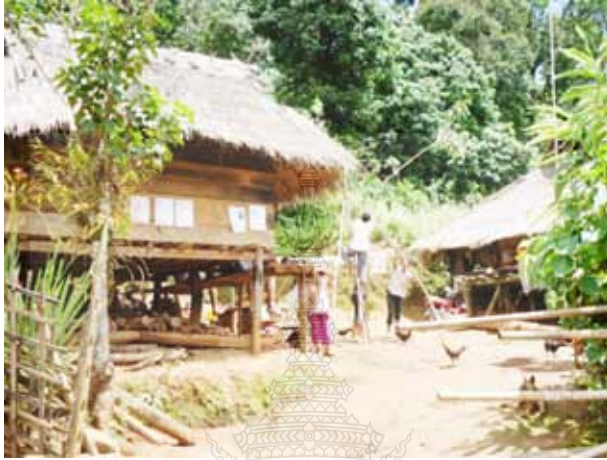
ภาพที่ 4 การสร้างชิงช้าสำหรับเด็ก จะสร้างไว้บริเวณบ้าน