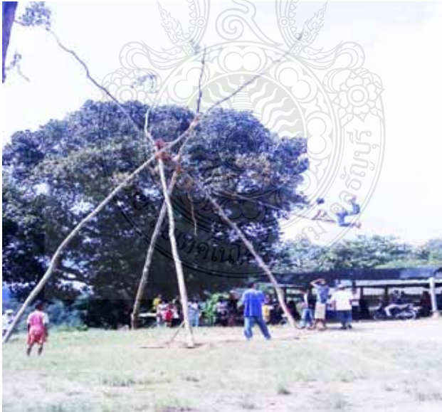
ภาพที่ 3 การโล้ชิงช้าของชนเผ่าอ่าซ่า

ถือว่าเป็นการเปิดพิธีการโล้ เสร็จแล้วจากนั้นคนอื่นๆ จึงจะโล้ได้ ตอนเย็นจะมีการกระทู้งกระบอกไม้ไผ่โดยคนหนุ่มสาวจะเต้นรำพื้นบ้านตลอดทั้งคืน วันที่สามถือว่าเป็นวันที่ยิ่งใหญ่ มีการประกอบพิธีเซ่นไหว้ตั้งแต่เช้ามืดโดยใช้เครื่องเซ่นไหว้เหมือนวันแรก ยกเว้นจะไม่มีไก่ในการเซ่นไหว้เท่านั้น การเซ่นไหว้ของวันนี้จะทำในตอนเช้า เมื่อทำพิธีกรรมเซ่นไหว้ในช่วงเช้าเสร็จแล้วชุมชนจะมีการฆ่าหมูหรือสัตว์ใหญ่ เช่น วัว ควาย เพื่อมาใช้บริโภคร่วมกัน ถือว่าเป็นวันที่ชุมชนมีการเลี้ยงฉลองกันอย่างยิ่งใหญ่ตอนกลางคืนจะเต้นรำพื้นบ้าน จนถึงเวลาเที่ยงคืน วันที่สี่ เป็นวันสุดท้ายของเทศกาลโล้ชิงช้า ซึ่งจะมิกิจกรรมโล้ชิงช้าเป็นหลัก เมื่อตกตอนเย็นจ๊ะเอ๋ ผู้นำวัฒนธรรมจะเป็นผู้ทำการปิดการโล้ชิงช้าของปีนั้น