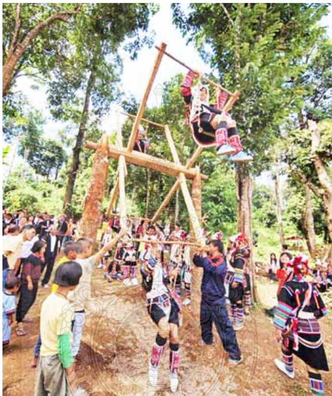
ภาพที่ 5 พิธีกรรมที่โดดเด่นของชนเผ่าอาข่า ถูกนำมาเพิ่มศักยภาพ ด้านวัฒนธรรมตามแนวทางเศรษฐกิจสร้างสรรค์