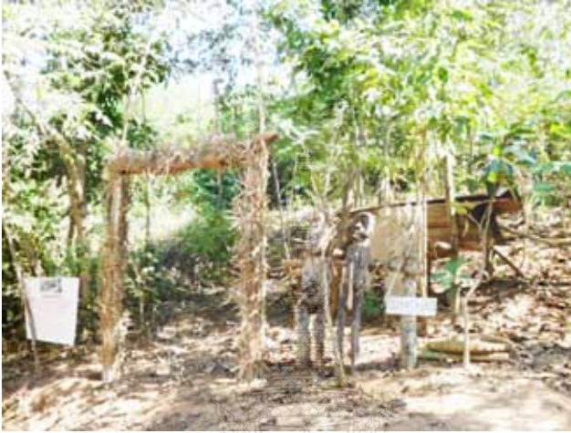
ภาพที่ 2 ลักษณะประตู่หมู่บ้าน ซึ่งเป็นความเชื่อของชนเผ่าอาข่า