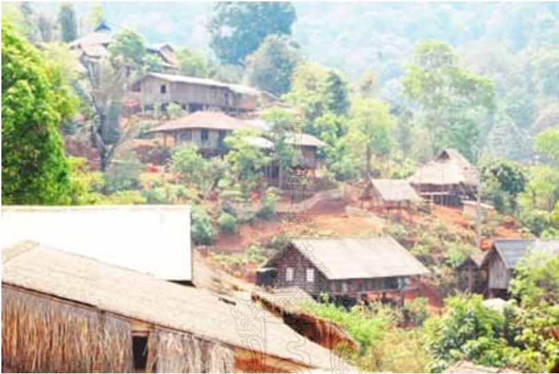
ภาพที่ 1 สภาพที่อยู่อาศัยของชนเผ่าอ่าซ่า