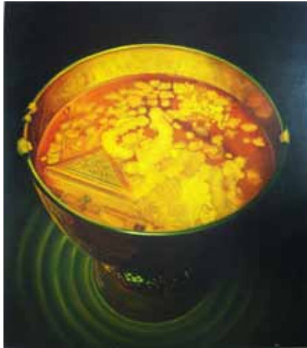
ภาพที่ 3. วัตถุแห่งความศรัทธา 2, 2554, สีนํ้ามันบนผ้าใบ, 170 x 154 ซม.