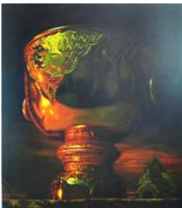
ภาพที่ 2. วัตถุแห่งความศรัทธา 1, 2554, สีนํ้ามันบนผ้าใบ, 170 x 151 ซม.