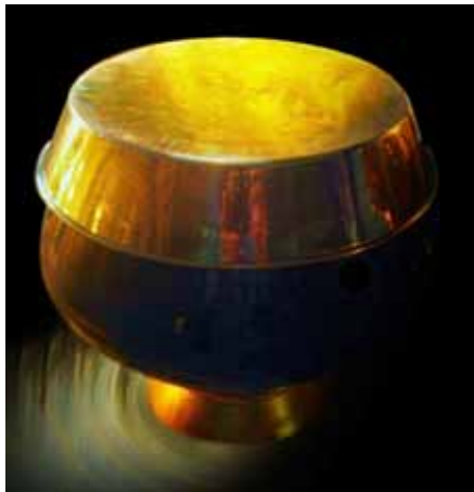
ภาพที่ 4. ภาพสะท้อนความศรัทธา 2, 2554, สีนํ้ามันบนผ้าใบ, 170 x 154 ซม.