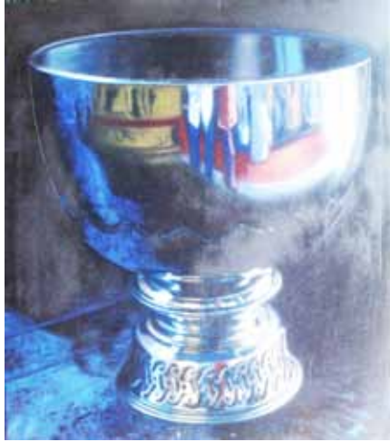
ภาพที่ 1. ภาพสะท้อนแห่งความศรัทธา 1, 2553, สีน้ำมันบนผ้าใบ, 100 x 90 ซม.