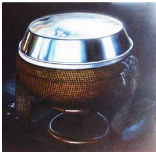
ภาพที่ 4. ภาพสะท้อนแห่งความศรัทธา 2, 2553, สีน้ำมันบนผ้าใบ, 110 x 110 ซม.