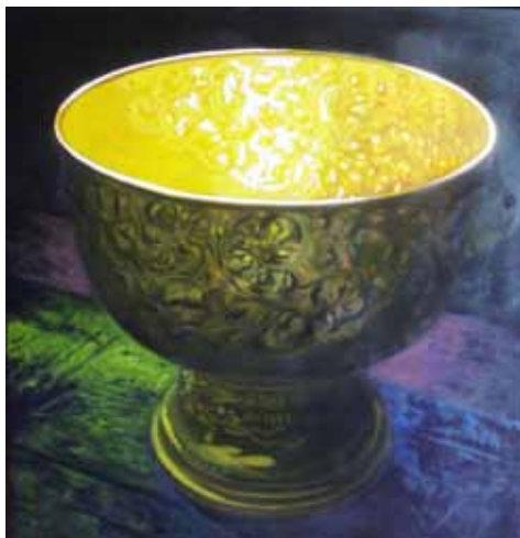
ภาพที่ 3. วัตถุแห่งความศรัทธา 2, 2553, สีน้ำมันบนผ้าใบ, 105 x 100 ซม.