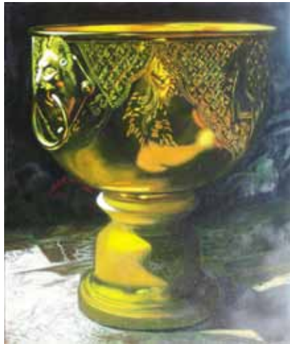
ภาพที่ 2. วัตถุแห่งความศรัทธา 1, 2553, สีน้ำมันบนผ้าใบ, 100 x 90 ซม.