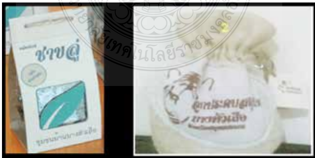
ภาพที่ 2 และ 3 การออกแบบบรรจุภัณฑ์ซาไบชูลู และบรรจุภัณฑ์ลูกประคบสมุนไพร

การพัฒนาและการออกแบบบรรจุภัณฑ์ลูกประคบสมุนไพร ผู้วิจัย ได้พัฒนาบรรจุภัณฑ์ต้นแบบขึ้นมาโดยมีลักษณะถุงบรรจุภัณฑ์สามารถบรรจุ ลูกประคบได้อย่างลงตัว ที่ดูได้แสดงชื่อสินค้าและตราสัญลักษณ์สินค้าของชุมชน เพื่อง่ายต่อการจดจำสินค้าของผู้บริโภค และประโยชน์เพิ่มของถุงบรรจุภัณฑ์ ลูกประคบ คือลูกค้าสามารถไปใช้บรรจุสิ่งของอย่างอื่นได้ตามความเหมาะสม ลดการใช้ถุงพลาสติก เนื่องจากถุงบรรจุภัณฑ์ผลิตมาจากผ้าป่านและผ้าดิบ ดังภาพที่ 3