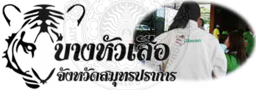
ภาพที่ 7 ภาพต้นแบบสัญลักษณ์ของชุมชนบางหัวเสือ

การออกแบบและพัฒนาสื่อสัญลักษณ์ชุมชนบางหัวเสือ ผู้วิจัยได้ร่วมกับสมาชิกในชุมชน คัดเลือกภาพร่างที่เหมาะสมลงตัว โดยได้ช่วยกันแสดงความคิดเห็นในการออกแบบภาพร่างออกมาเพียง 1 ภาพร่างเท่านั้น ตามมโนทัศน์ของแต่ละคน และหลังจากที่ได้ภาพร่างที่เกิดจากมติของกลุ่มวิสาหกิจชุมชนแล้ว ผู้วิจัยได้นำภาพร่างสัญลักษณ์ชุมชนบางหัวเสือให้ผู้เชี่ยวชาญด้านการออกแบบในมหาวิทยาลัยเทคโนโลยีราชมงคลกรุงเทพ ช่วยพิจารณาความเหมาะสมในด้านลายเส้น โครงสร้างภาพ และความสมดุลของภาพโดยผู้เชี่ยวชาญได้ให้คำแนะนำ จนกระทั่งได้ภาพร่างที่เหมาะสมที่สุด หลังจากนั้น ผู้วิจัยได้นำไปออกแบบต่อด้วยโปรแกรมสำเร็จรูปจากคอมพิวเตอร์ จนได้สัญลักษณ์ชุมชนบางหัวเสือ อำเภอลำปาง จังหวัดลำปาง ซึ่งมีชื่อบอกชุมชนและรูปหัวเสือ เพื่อการนำไปใช้ประโยชน์ในด้านการประชาสัมพันธ์ชุมชน ดังภาพที่ 7