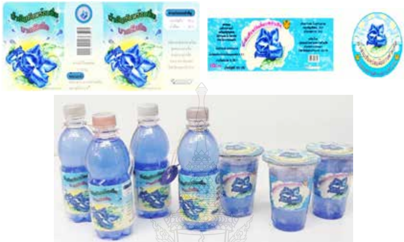
ภาพที่ 5 การออกแบบและพัฒนาบรรจุภัณฑ์น้ำสมุนไพรอัญชันพร้อมดื่ม

การพัฒนาผลิตภัณฑ์ยาหม่องสมุนไพร จากผลการสังเกตแบบไม่มีส่วนร่วมของผู้วิจัย พบว่าหากสมาชิกลดต้นทุนค่าใช้จ่ายในเรื่องยาหม่องขนาดได้สมาชิกในกลุ่มสามารถผลิตได้เองตามภูมิปัญญาแพทย์แผนไทยดั้งเดิม โดยเน้นในเรื่องความสะอาดของวัสดุ อุปกรณ์ และสถานที่ผลิต ทางกลุ่มวิสาหกิจขนาดสุภาพ ก็จะสามารถลดค่าใช้จ่ายได้มาก อีกทั้งสามารถจำหน่ายให้กับลูกค้าที่สนใจได้อีกด้วย การผลิตยาหม่องสูตรตั้งต้น มีวัสดุอุปกรณ์ (ภาพที่ 3) และวิธีการทำ ดังนี้