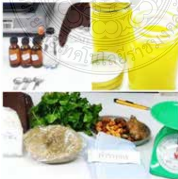
ภาพที่ 6 วัสดุอุปกรณ์ในการทำน้ำมันเสลดพังพอนและยาหม่องสมุนไพร

วิธีทำ นำพิมเสน น้ำมันยูคาลิปตัส น้ำมันสะระแห่น ผสมกันให้ละลาย จากนั้นผสมเมนทอลลงไปทีละน้อย คนให้เข้ากันจนกว่าเมนทอลจะหมด นำส่วนของน้ำมันเสลดพังพอนผสมกับเครื่องหอมส่วนที่ 2 (พิมเสน น้ำมันยูคาลิปตัส น้ำมันสะระแห่น และเมนทอล) เสร็จแล้วกรองน้ำมันเสลดพังพอนที่ผสมแล้วด้วยผ้าขาวบาง (พับหนา 2 ชั้น) จากนั้นผสมน้ำมันลาเวนเดอร์ เสร็จแล้วบรรจุใส่ภาชนะ