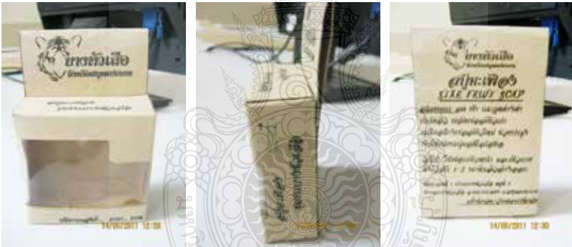
ภาพที่ 4 การออกแบบบรรจุภัณฑ์สบู่มะเฟือง

การออกแบบบรรจุภัณฑ์สบู่มะเฟือง ซึ่งเป็นผลิตภัณฑ์ของกลุ่มวิสาหกิจ ผลิตภัณฑ์ของใช้ในครัวเรือน ลักษณะของบรรจุภัณฑ์มีดังนี้ โครงสร้างเป็น กล่องรูปสี่เหลี่ยม เนื่องจากรูปแบบสบู่เป็นสี่เหลี่ยม สามารถจัดเรียงเพื่อการ จำหน่ายและการขนย้ายได้ง่าย รวมทั้งเมื่อเข้าสู่ระบบการพิมพ์อุตสาหกรรมจะได้ ในราคาที่ถูก สีที่ใช้จะเลือกใช้ตามชนิดของสมุนไพร องค์ประกอบการออกแบบ และพัฒนาบรรจุภัณฑ์ต้นแบบ ได้แสดงถึง ประเภทส่วนประกอบหรือส่วนผสม โดยประมาณ คุณค่าทางสมุนไพร ขั้นตอนหรือวิธีใช้ การเก็บรักษาวันที่ผลิตและ วันหมดอายุ คำบรรยายสรรพคุณ และข้อมูลเกี่ยวกับผู้ผลิต ดังภาพที่ 4