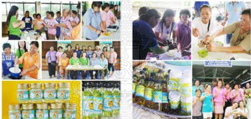
ภาพที่ 8 การถ่ายทอดเทคโนโลยีการทำยาหม่อง-น้ำมันเมล็ดฟักพอนสมุนไพรสู่ชุมชนบางหัวเสือ

น้ำมันนวดจากเมล็ดฟักพอน การจัดฝึกอบรมเชิงปฏิบัติการการทำผลิตภัณฑ์ยาหม่องสมุนไพร ได้จัดขึ้นในวันที่ 23-24 เดือนมิถุนายน 2555 ณ ห้องประชุมโรงเรียนบางหัวเสือ มีสมาชิกกลุ่มวิสาหกิจนวดสุขภาพและชาวบ้านชุมชนบางหัวเสือที่สนใจเข้าร่วมอบรม จำนวน 30 คน ผู้เข้าร่วมอบรมได้เรียนรู้วัสดุอุปกรณ์ และวิธีการทำยาหม่องสมุนไพร และน้ำมันนวดเมล็ดฟักพอน ตลอดจนเทคนิคต่างๆ (ภาพที่ 8)