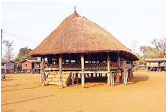
ภาพที่ 4 หอกว๊าน สร้างขึ้นเพื่อใช้ในการทำพิธีกรรมฮีดคองประเพณี งานบุญ การประชุมและการต้อนรับแขก และงานจัดเลี้ยงที่เป็นกิจกรรมส่วนรวมของชนเผ่า ไม่นิยมกันฝา ใต้ถุนสูง พื้นที่ทำตามเสามีการประดับประดาตกแต่งด้วยรูปแกะสลัก เป็นรูปสัตว์ตามความเชื่อ

ได้ ประกอบกับภูมิภาคนี้เป็นเขตร้อนชื้น มีสัตว์เลื้อยคลานโดยเฉพาะงูชุกชุม คนเลยกลัวงู แล้วบูชางูเป็นสิ่งมีอำนาจเหนือธรรมชาติ (สุจินต์ วงศ์เทศ. 2557) การนับถือผีบรรพบุรุษหรือมีลัทธิความเชื่อต่างๆ หากสามารถส่งผลให้บุคคลนั้นเป็นคนดีไม่เบียดเบียนผู้อื่นถือเป็นสิ่งที่ดี ทั้งนี้ ความเชื่อของเผ่ากะตู่ โดยเฉพาะอย่างยิ่งใน ด้านความเชื่อเรื่องผี จิตวิญญาณและสิ่งศักดิ์สิทธิ์ จะมีคำเรียกผีคนตายว่า “กะมัช” และเรียกผีอื่นๆ ว่า “ยาง” ซึ่งมีอยู่มากมายเช่น ผีฟ้า ผีดิน ผีกไม้ ผีภู ผีเรือน ผีبوب ผีเหล่านี้อาจจะมีบทบาทต่อการดำรงชีวิตประจำวันของชาวกะตู่เป็นอย่างมาก ชาวกะตู่จึงเชื่อว่า สิ่งศักดิ์สิทธิ์หรือผีนั้นมีทั้งดีและร้าย คอยปกป้องดูแลและสามารถให้คุณให้โทษแก่พวกเขาได้ (ลาวัลย์ สังข์พนธ์านนท์, 2553 : 6) ดังนั้นเผ่ากะตู่จึงมีการเลี้ยงผีไว้ประจำบ้าน และมีพิธีกรรมฆ่าควายเลี้ยงผีและแบ่งฮีดกินควายด้วย