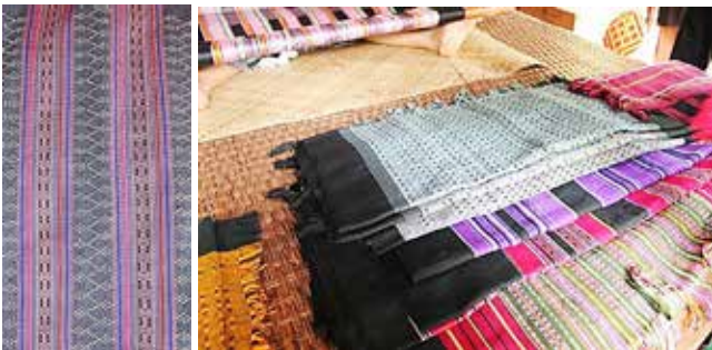
ภาพที่ 8 ผ้าทอที่ตกแต่งด้วยลูกปัดสีเส้นต่างๆ

จากต้นไม้ เปลือกไม้ ลวดลายจะเป็นลายริ้วเล็กและใหญ่สลับสีกันลายตามขวาง บางผืนลายริ้วใช้สีตัดกันแต่พอสวยงามไม่มากเกินไป บางลายใช้สีได้กลมกลืน เช่น สีม่วง ชมพู น้ำเงิน ฟ้ำ หรือ แดงเลือดหมู ดำ เหลือง แต่สิ่งที่เป็นจุดเด่นมากที่สุดของผ้าทอคือการทอผ้าที่สอดแทรกลูกปัดสีขาวลงไป在线ด้ายเป็นลวดลายเรขาคณิตวางจังหวะได้อย่างเป็นระเบียบ สวยงามทันสมัย เส้นใยทั้งเส้นตั้งและเส้นพุ่งที่ทอมีความหนาแน่นสูง (ภาพที่ 8) ผ้าทอเหล่านี้เหมาะที่จะนำไปใช้เป็นผ้าชิ้นนุ่ง หรือทำตีนซิ่น การทอผ้าทำด้วยมือต้องใช้เวลาานกว่าจะได้แต่ละผืน นับเป็นงานศิลปะที่มีคุณค่าทางใจเมื่อได้เป็นเจ้าของ อุปกรณ์ที่ใช้ในการทอแสดงถึงภูมิปัญญาของบรรพบุรุษที่แก้ปัญหาคิดค้นรูปแบบการทอให้เข้ากับสิ่งแวดล้อมการอยู่อาศัย สะดวกในการเคลื่อนย้าย ในอดีตการทอผ้าของผู้หญิงชาวกะตู่เพื่อใช้สอยในครอบครัว แต่ปัจจุบันพวกเขาใช้ผ้าทอนี้เฉพาะมีงานประเพณีสำคัญเท่านั้น