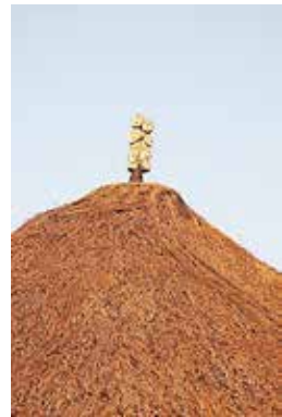
ภาพที่ 10 งานแกะสลักหัตถกรรมเสารูปคน รูปคนนั่งปิดหู รูปคนยืนหลังคา เป็นการแกะสลักที่เกิดขึ้นจากคติความเชื่อและประดับประดาไว้ภายนอกหอกว้าน