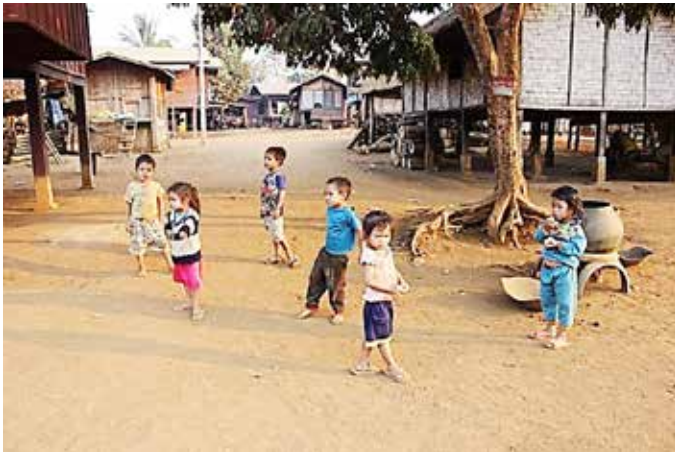
ภาพที่ 5 สภาพความเป็นอยู่ของชาวเผ่ากะตุ นิยมสร้างบ้านเรือนใกล้กันบริเวณใต้ถุนบ้านจะใช้สำหรับพักผ่อน จากงานไร่นา เช่น การทอผ้า การจักสาน ตำข้าว เลี้ยงลูก หรือ นั่งสูบก๊อกลยา มีลานกว้างสำหรับให้เด็กๆ วิ่งเล่นกัน

สภาพวิถีความเป็นอยู่ของชนเผ่ากะตุส่วนใหญ่แล้ว ยังมีความพึงพอใจกับวิถีแบบบรรพบุรุษอย่างเรียบง่าย แบบพอเพียง และรักษาประเพณีวัฒนธรรมไว้อย่างเหนียวแน่น (ภาพที่ 5) ผลผลิตภัณฑ์เครื่องใช้ต่างๆ ในชีวิตประจำวันยังคงอาศัยวัสดุจากธรรมชาติ มีชีวิตที่เป็นมิตรกับสิ่งแวดล้อมด้วยการนำวัสดุที่คุ้นเคยนั้นคือ ไม้ไผ่ อาจกล่าวได้ว่าวัฒนธรรมไม้ไผ่ มานำใช้สอย ตั้งแต่การสร้างบ้านเรือน การประดิษฐ์ข้าวของภาชนะเครื่องใช้ต่างๆ ด้วยฝีมือวิธีแบบดั้งเดิม อาจจะไม่ได้มีรสนิยมที่เน้นความงาม มากนัก ด้วยวัสดุและวิธีการที่ทำกันมาในอดีต จัดเป็นงาน “หัตถกรรม” ที่ทรงคุณค่าตามแบบอย่างของท้องถิ่นได้ดี