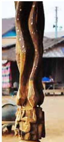
ภาพที่ 9 การแกะสลักภาพงูห้อยหัวลง การแกะสลักไม้ซึ่งทำด้วยคติความเชื่อ ความศรัทธา ส่วนใหญ่ใช้สำหรับตกแต่งประกอบสถาปัตยกรรม

งานแกะสลักของเผ่ากะตุ มีการแกะสลักไม้ซึ่งทำด้วยคติความเชื่อ ความศรัทธา ส่วนใหญ่ใช้สำหรับตกแต่งประกอบสถาปัตยกรรม มีศาลากลางประจำหมู่บ้านหรือที่เรียกว่า “หอกว้าน” สร้างขึ้นบริเวณหน้าทางขึ้นบันไดรูปทรงของอาคารมีเสาแกะสลักรูปคน และเสารูปลิงทำนั่ง โดยบนหัวลิงมีรูปแกะสลักเป็นรูปกบเหยียดขาครอบเสาห้อยหัวลง และต่อด้วยรูปงูเลื้อยลงมาครอบเสา ลักษณะห้อยหัวลงจากเสาเหมือนกัน (ภาพที่ 9) ฝีมือการแกะสละลงบนไม้ท่อนซุงถือว่ามึทักษะความชำนาญมาก สังเกตเห็นได้จากสัดส่วนของกบท่าทางเหยียดขา และสัดส่วนระหว่างงูกับกบ ส่วนตัวกบมีการทำลวดลายแต้มสีบนพื้นผิว ภายในอาคาร มีรูปแกะสลักไม้แบบนูนสูงปรากฏบนคานไม้ เป็นรูปทรงของสัตว์ต่างๆ เช่น ช้าง หมู กระต่าย งู นก ตะกวด กบ เต่า ลิง หมาควาย และที่แปลกกว่ารูปอื่น คือ การแกะสลักรูปทรงคนครึ่งตัวแต่งกายใส่สูทผูกเนคไท