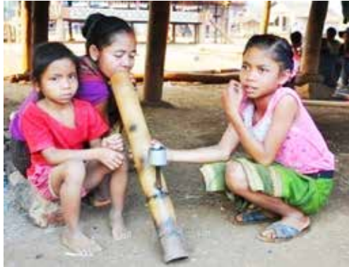
ภาพที่ 3 การสูบก๊อกรา เป็นการสูบยาเส้นด้วยบ้องไม้ไผ่ซึ่งเป็นความนิยมของเผ่ากะตุ โดยจะพบเห็นได้จากทั้งเด็กและผู้ใหญ่

เขาจะได้มีคนมาช่วยแบ่งเบาภาระการทำงานอีกแรงหนึ่ง (สุวรรณ จันทะดารา, 2554 : 267)