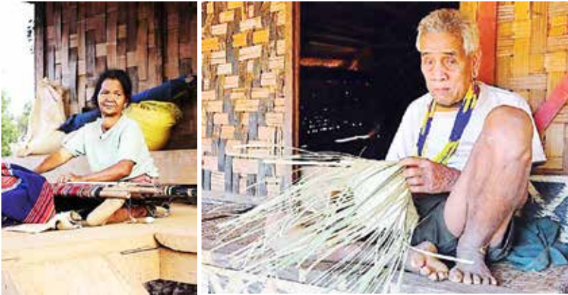
ภาพที่ 7 ผู้หญิงทอผ้า ผู้ชายจักสาน

ผู้หญิงชาวเผ่ากะตู่จะทอผ้าแก่ง จึงมีหน้าที่ในการทอผ้า เนื่องจากผู้หญิงสามารถบรรจงประดิษฐ์ลวดทอตามจินตนาการได้ดีกว่าผู้ชาย ส่วนผู้ชายจะมีฝีมือในการจักสานหน้าที่ของผู้ชายกะตู่เมื่อว่างจากงานอาชีพทำไร่ทำสวน ก็จะมาจักสานเป็นอาชีพเสริม