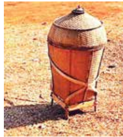
ภาพที่ 6 ศิลปหัตถกรรมเผ่ากระตู่ ส่วนใหญ่เป็นงานจักสาน ประเภทกรงนก, ช้องใส่ปลา, กระพา ตะกร้าเอนกประสงค์ รั้งไก่