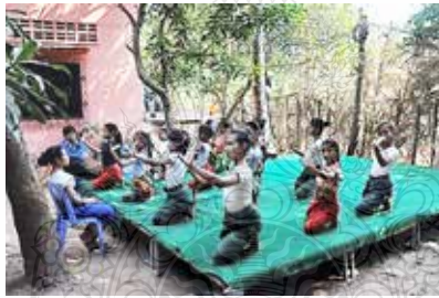
ภาพที่ 4 ภาพการเรียนการสอนด้านนาฏศิลป์