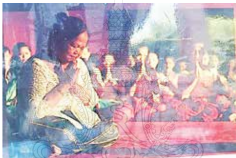
ภาพที่ 5 ภาพการเคารพบูชาครูและการฝากตัวเป็นลูกศิษย์

สัดส่วนตามองค์ประกอบทางศิลปะและเหมาะกับรูปร่างของตน โดยผู้เรียน หรือผู้แสดงที่ดีจำเป็นที่จะต้องฝึกฝนด้วยความมานะพยายาม ไม่ย่อท้อ และ รู้จักสังเกตจากครูที่ทำการถ่ายทอดให้อย่างละเอียดถี่ถ้วน ดังนั้นการเรียนรำ นาฏศิลป์ให้เกิดสัมฤทธิ์ผลเพื่อการเป็นนาฏศิลปินที่ดีนั้นสามารถฝึกหัดกันได้ เพราะคงไม่มีสิ่งใดที่เกินความสามารถของมนุษย์เป็นแน่แท้