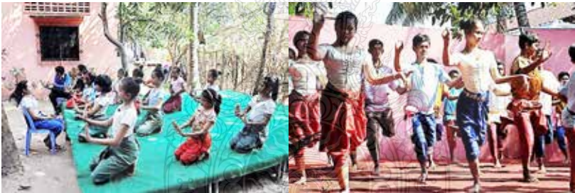
ชุดภาพที่ 10 ภาพรูปแบบการฝึกหัดนาฏศิลป์

ซึ่งในปัจจุบันทางสมาคมได้มีการเรียนการสอนแบบใช้ผู้เรียนในระดับสูงเป็นผู้ถ่ายทอดให้กับผู้เรียนอื่น ๆ หรือถ่ายทอดกันเอง อันเนื่องมาจากครูผู้ใหญ่ในราชสำนักที่มีคุณวุฒิและประสบการณ์เชี่ยวชาญมีจำนวนที่เหลือน้อยและบางท่านก็ชราภาพไม่สามารถเดินทางมาสอนหรือถ่ายทอดทำรำให้กับผู้เรียนได้อีก ดังนั้นเป็นหน้าที่ของเรียนเองที่จะต้องศึกษาเล่าเรียน เก็บเกี่ยวองค์ความรู้และหมั่นฝึกฝน เพื่อให้เกิดความชำนาญ และทำหน้าที่เป็นผู้อนุรักษ์ สืบทอด และถ่ายทอดองค์ความรู้นี้สืบต่อไป (สัมภาษณ์ Nguon Vuthy, 3 กุมภาพันธ์ 2558)