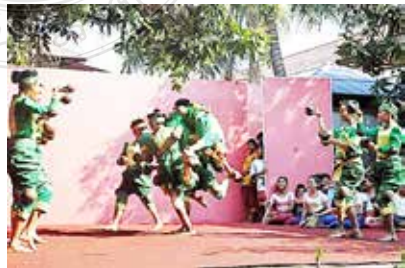
ชุดภาพที่ 7 ภาพรูปแบบนาฏศิลป์พื้นเมือง (ระบำจับปลา-ระบำตักแตน)