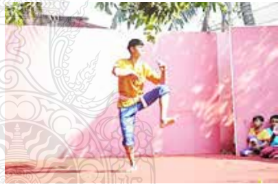
ชุดภาพที่ 6 ภาพรูปแบบนาฏศิลป์ในราชสำนัก (ระบำ-โขน)