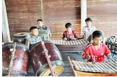
ภาพที่ 3 ภาพการเรียนการสอน ด้านดุริยางคศิลป์