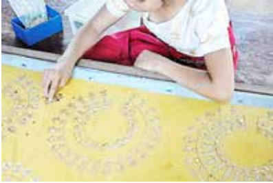
ภาพที่ 2 ภาพการเรียนการสอน ด้านหัตถศิลป์