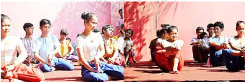
ชุดภาพที่ 9 ภาพการเตรียมความพร้อมของร่างกายก่อนการฝึกปฏิบัติ

1.3 ความพร้อมด้านผู้เรียน ในที่นี้ความพร้อมของผู้เรียน ทั้งทางร่างกายและจิตใจให้สมบูรณ์แข็งแรง การมีส่วนร่วมของสรีระที่ลงตัว และเหมาะสมกับการเรียน ซึ่งการคัดเลือกเช่นนี้จะเริ่มกระทำเมื่อหัดเรียน หากผู้ใดมีสรีระที่ไม่สามารถที่จะเรียนได้แล้วจะถูกตัดสิทธิ์ในการเรียน เมื่อจะเริ่มเรียนนั้นจำเป็นที่เราจะต้องรู้ว่าสรีระของเรานั้นเหมาะสมที่จะเรียนในบทบาทใด เช่น พระ นาง ยักษ์ หรือลิง โดยมากแล้วครูจะเป็นผู้กำหนดให้นักเรียน โดยครูจะตรวจดูลักษณะใบหน้า ความสูง รูปร่าง เมื่อครูผู้สอนพิจารณาสรีระตามแต่บุคคลแล้ว ก็จะแยกตามบทบาทเป็นหมวดเพื่อเตรียมความพร้อมทางร่างกาย เพื่อให้ได้สัดส่วนการรำที่งดงาม โดยบังคับกล้ามเนื้อหรือกระดูกบางส่วนให้ผิดรูปไป รวมทั้งเป็นการบริหารเพื่อให้การเคลื่อนไหวเมื่อรำเป็นไปอย่างต่อเนื่องและมีพลัง